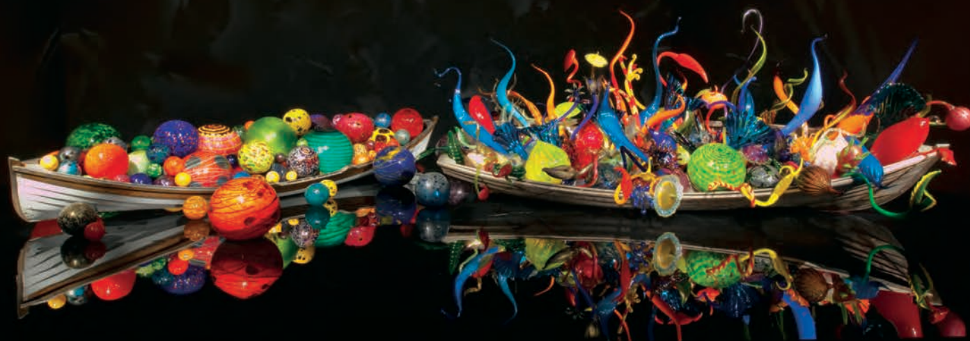
Dale CHIHULY, Mille Fiori , 2008. 2,9 x 17,1 x 3,7 m. Photo: David EMERY. Avec l'aimable autorisation/Courtesy Musée des beaux-arts de Montréal.

entre autres Venise et Jérusalem, ainsi réaménagés en carrefours trans-temporels et transculturels où, pour le temps de leur exposition, les lustres chatoyants et voluptueux ravivent plus qu'ils ne contredisent l'architecture marquée par l'usure.