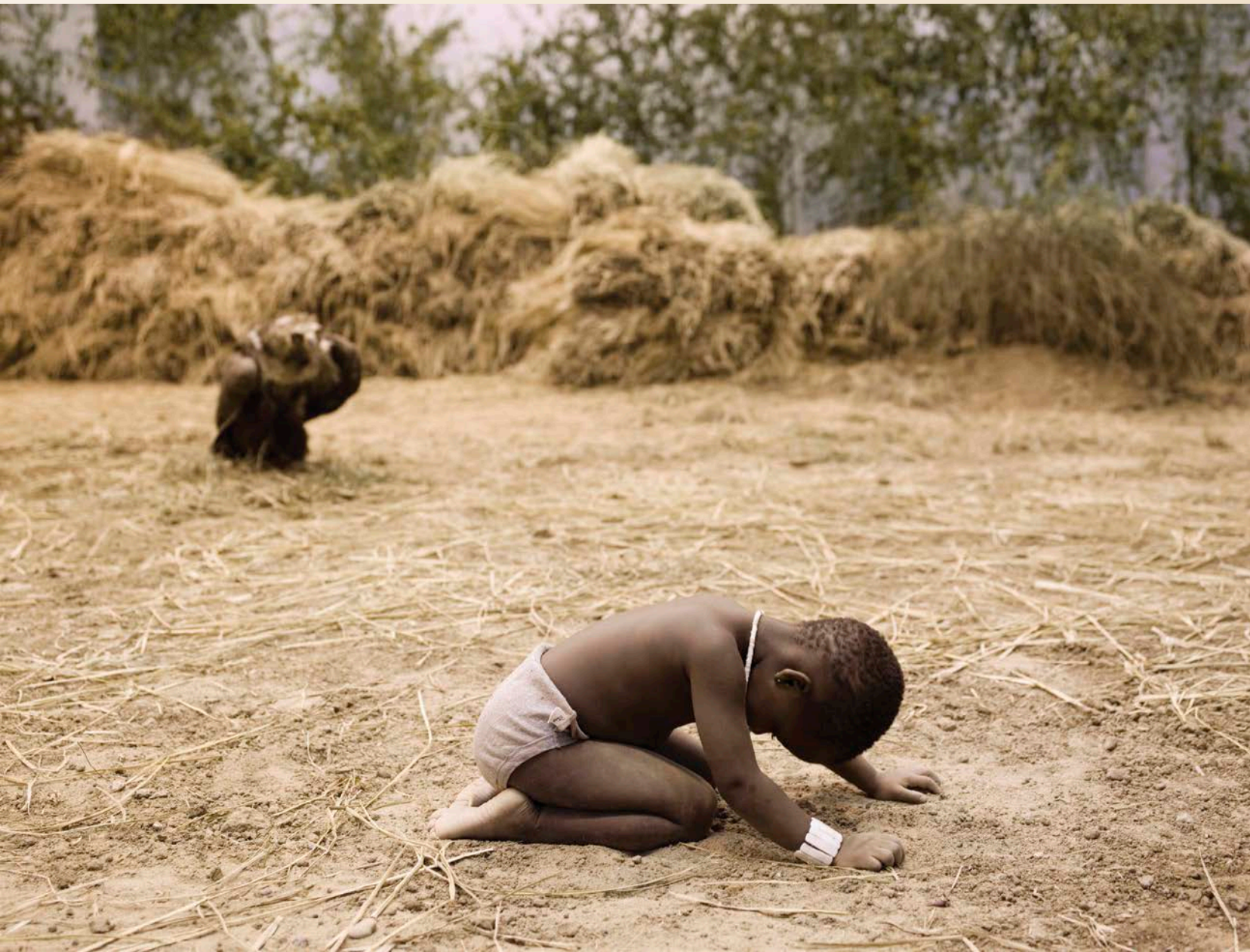
Xu Zhen , The Starving of Sudan , 2008. Installation, performance, technique mixte/mixed media.