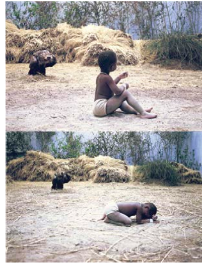
Xu Zhen, The Starving of Sudan , 2008. Installation, performance, technique mixte/mixed media.

To explain the main factor leading to the common use of criticism in the contemporary art diorama, let us return to the epistemological evolution. Daguerre's spectacle, to which the first definition of diorama is attached, disappeared with the arrival of movies – so much so that it is being rediscovered today. 9 The diorama form, however, has remained alive in museums, which have been producing them since 1875. 10 The museum definition of "diorama" is "a visual composition consisting of a representation of a landscape or a scene expressing a historical fact,