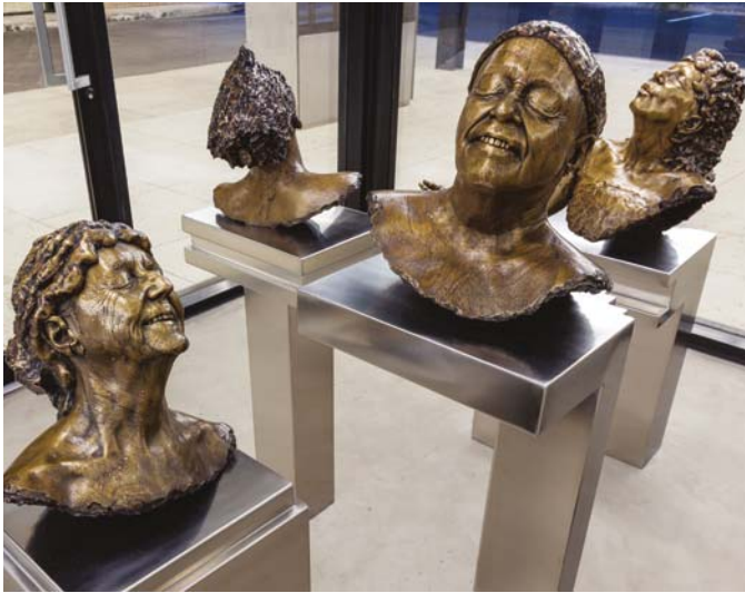
Francis Montillaud, Carrefour , 2013. Bronze et acier inoxydable, dimensions variables/Bronze and stainless steel, variable dimensions.

P. 18-19 : Francis Montillaud, Sur le vif , 2011. Plâtre, pigments, bois et acier, dimensions variables/Plaster, pigment, wood and steel, variable dimensions.