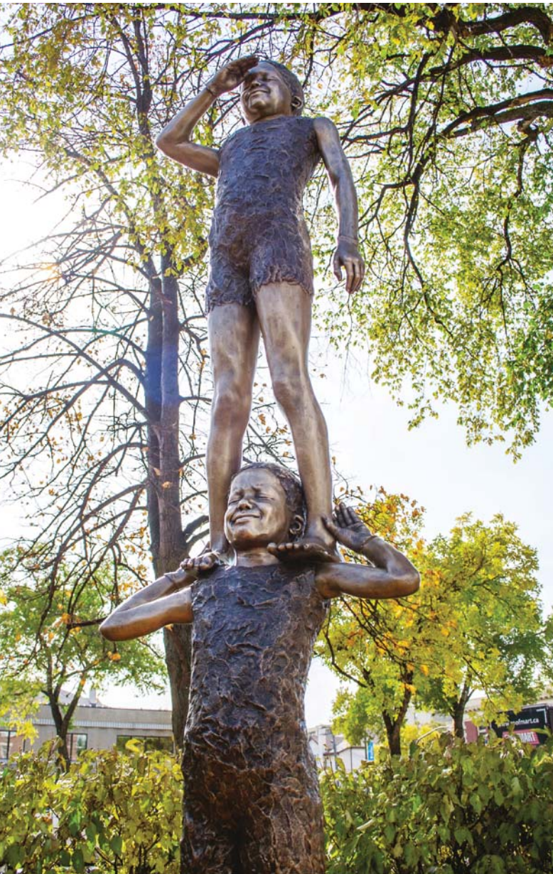
Francis Montillaud, Curiosités , 2012. Bronze, dimensions variables/variable dimensions.

In a recent work, Carrefour , 4 five bronze busts—three middle-aged people and two adolescents—translate the potential for encounters in an intergenerational cultural place through their placement in the space and the emotions expressed. Each face conveys a different sensibility, although inverting the qualities typically associated with the protagonists: serenity and well-being emanate from the young figures, whereas high spirits and extravagant laughter light up the older ones. The artist ensnares the stereotypes that would hold this to be the reverse, which is another way of settling a score with the conventional vocabulary bolstering the educational sections of museums. Montillaud has previously used the lifecasting technique ( sur le vif ) on local youth for another public art project titled Curiosités . 5 Made for the sculpture garden in St. Boniface—aply named given that its etymological meaning in Latin is “good figure”—the artist’s installation presented laughing children in acrobatic, comical and playful poses. Sur le vif , produced in 2011, is a work for which the sculptor used himself as a model to experiment with casting the multiple expressive possibilities of his face, curious to discover the gap between what he believes his self-image to be and what others actually see.