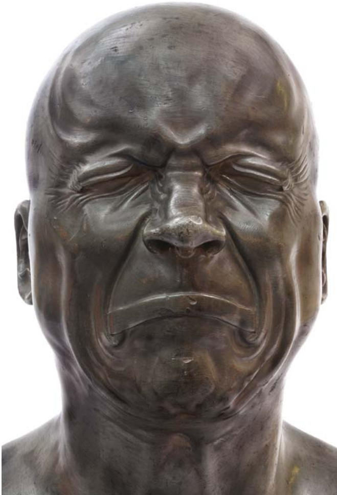
Franz Xaver Messerschmidt , Tête de caractère ( Homme de mauvaise humeur ), 1771-1783. Plomb/Lead, 380 cm en hauteur/in height. Collection Musée du Louvre, Paris.

Franz Xaver Messerschmidt is a key forerunner of artists working with the stylized grimace or exaggerated facial expression. Born in Austria in 1736, the sculptor is best known for his expressive portrait busts, which broke away from his earlier style—typical of 18th century Viennese Baroque—that had made him famous among the luminaries and aristocrats from whom he had received many commissions for statues and monuments. As his physical and mental states were deteriorating, Messerschmidt moved to Bratislava, where he began producing a collection of busts having demonstrative expressions, depicting a wide range of human behaviour. A contemporary of Gaspard Lavater and his Essays on Physiognomy (1775–1778, first published in English in 1789), Messerschmidt contributed to the scholar's research, illustrating the relationship between the facial features and the personality of individuals.