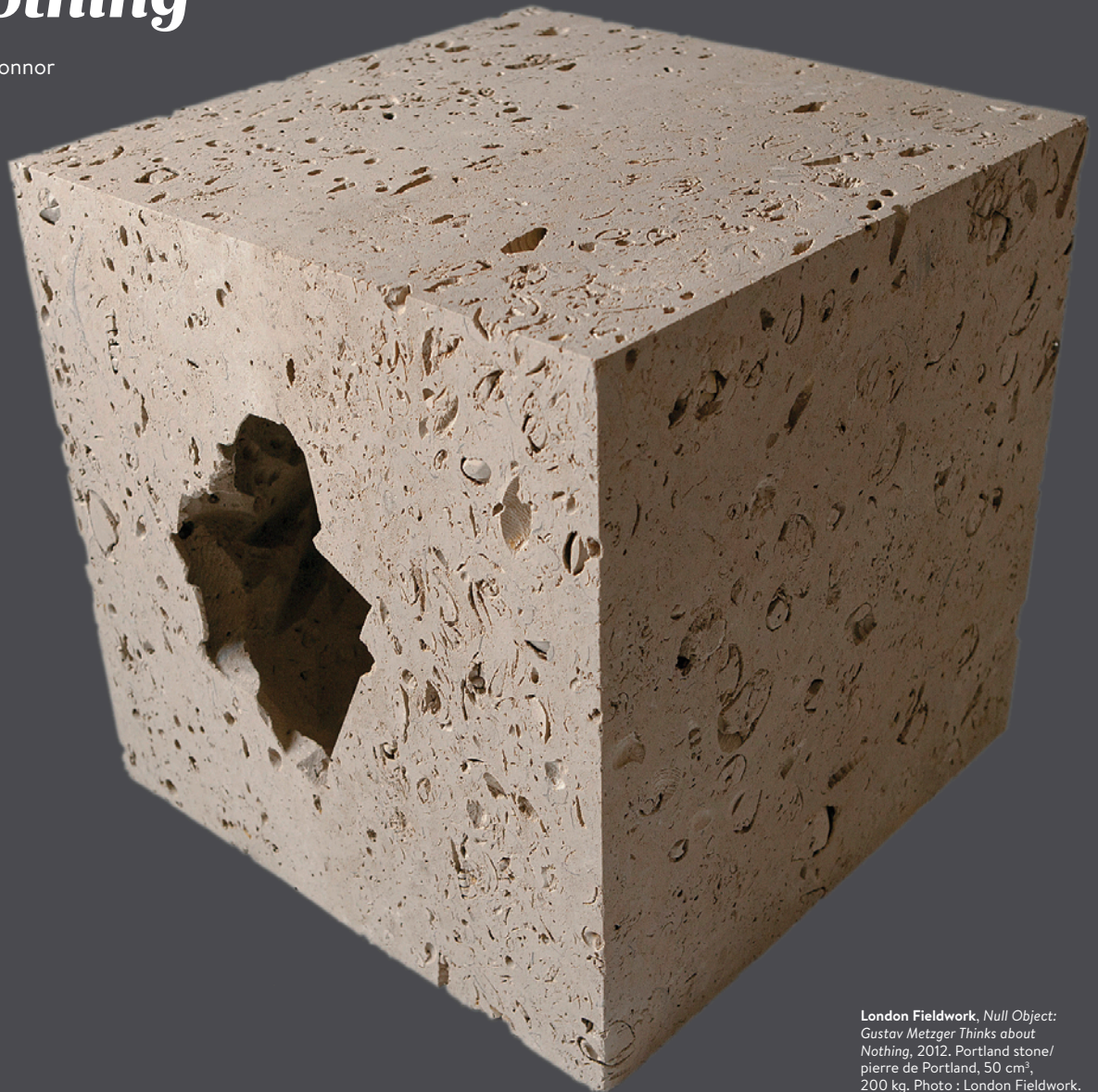
London Fieldwork, Null Object: Gustav Metzger Thinks about Nothing , 2012. Portland stone/ pierre de Portland, 50 cm 3 , 200 kg.