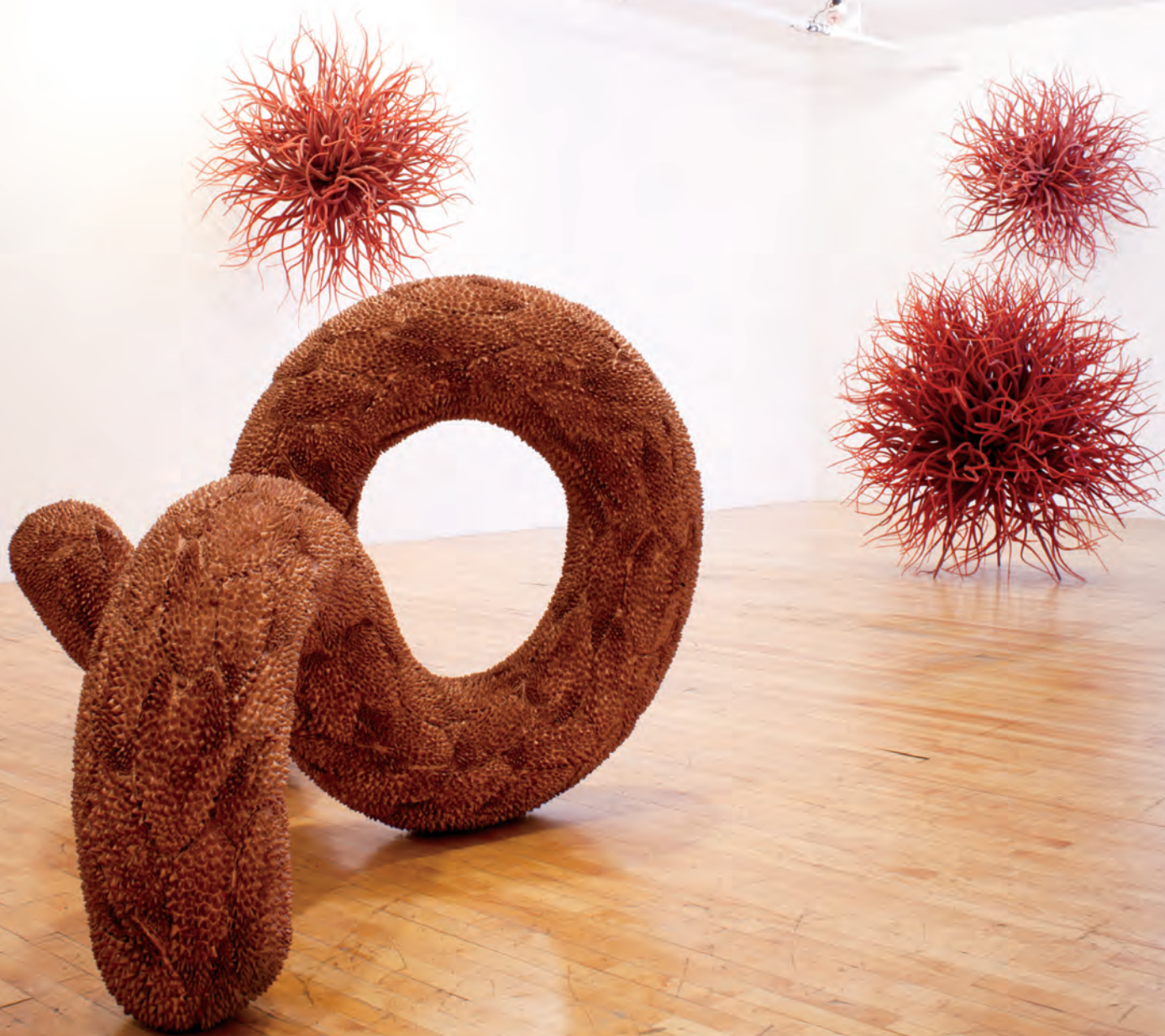
Denis ROUSSEAU, Gorganciel , 2013. Vue d'ensemble ( Les Gorgones et Le cuirassé de Spire ). Galerie Joyce Yahouda.