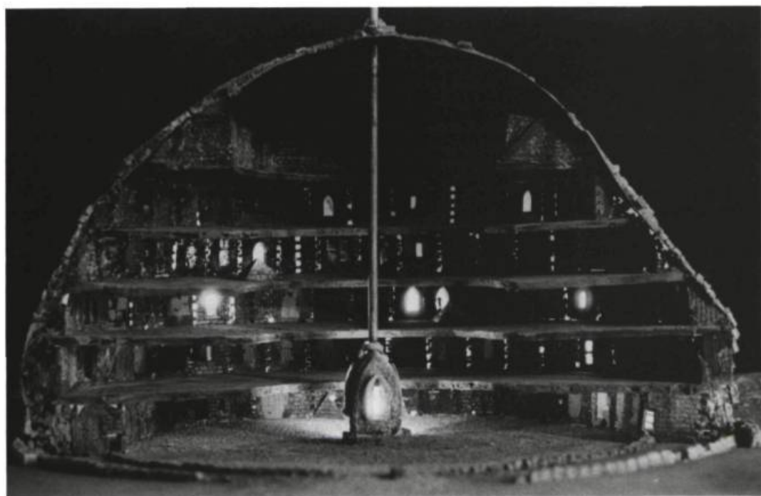
Habitation des femmes (nid), 1960-1964

Ma démarche est conceptuelle dans le sens d'une construction du réel. J'aime les idées; la clarté des idées qui permet au sujet d'être au cœur de l'action. D'où ma fascination pour l'anthropologie dans laquelle tout entoure une idée centrale, un concept défini - mais il ne faudrait pas croire pour autant que je respecte scrupuleusement la logique de cette science. Dans cet esprit, tous mes projets prennent forme dans mon lit, le matin. Comme ça, je demeure une heure ou deux au lit dans une phase de demi-sommeil, une sorte de transe ( a lucid dream ) qui me permet de laisser s'imprimer les images, les idées, les projets à faire. Ce qui m'amène à dire que la clarté de l'idée, du rêve va déterminer tout le reste, la qualité même du projet. Les rêves nous appartiennent un moment, mais pour ce qui est des idées elles pourraient bien appartenir à tout le monde puisqu'elles doivent évoluer. Voilà un peu pourquoi je n'en suis pas possessif.