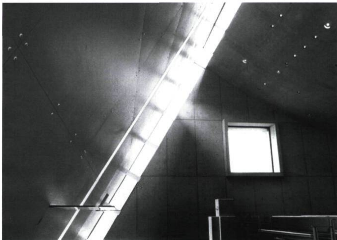
Lemay et associés, Chapelle de l'Amitié, 1992, Rivière-des-Prairies.

Avec l'accélération et la démultiplication des moyens de communication, le temps réel a pris, selon Paul Virilio, le contrôle sur l'espace physique et géographique, dissolvant tout sur son passage, y compris celle qui semblait la mieux protégée contre le passage du temps : l'architecture. « Privé de limites objectives, l'élément architectonique se met alors à dériver, à flotter, dans un éther électronique dépourvu de dimensions spatiales mais inscrit dans la seule temporalité d'une diffusion instantanée. » 1 Sans disparaître entièrement, l'architecture tend toutefois de plus en plus à dissoudre ses matériaux, à brouiller ses limites et à confondre ses espaces, bref à se rapprocher de la lumière.