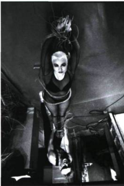
Istvan Kantor, Ninevah , 1997. Canada.

La 3 e Manifestation Internationale Vidéo et Art électronique Champ Libre , se tiendra à Montréal, du 23 au 29 septembre 1997.