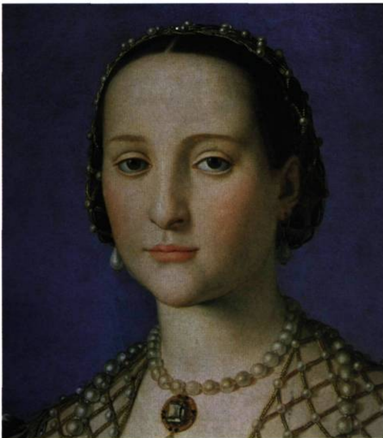
Agnolo Bronzino, Éléonore de Tolède, Duchesse de Toscane et son fils Giovanni , v. 1545. 115 x 95 cm (détail). Florence, Offices.

dépouille devenue la matière première de sa propre et trop périssable effigie. Ainsi œuvrent-ils à l'image du mort en représentation 3 .