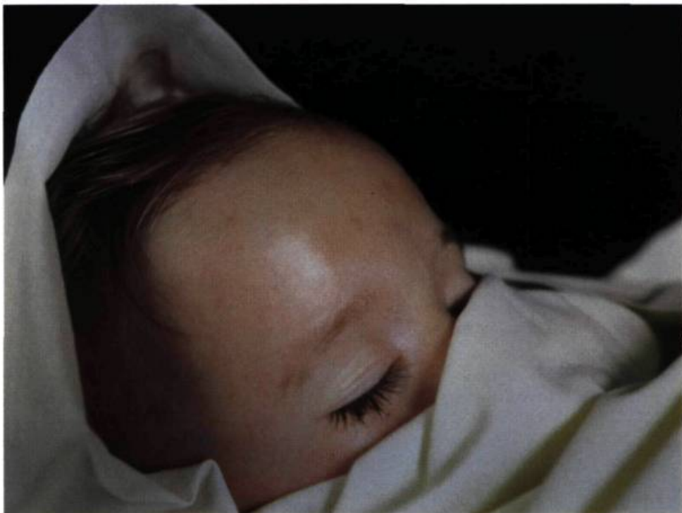
Andres Serrano, Fatal Meningitis II , 1992. Cibachrome; 125 x 152, 4 cm.

une créature vivante 4 . Voilà qui implique que Galatée passe de forme parfaite, idéale — inventée par l'artiste, qui a transcendé les apparences — à un corps particulier dans l'exactitude de tous ses détails. Qui alors, sinon Vénus, aura donné à Galatée le grain de sa peau, la couleur de sa chevelure, tout cet ensemble qui constitue la singularité d'un corps réel ? Car face à la profusion du réel, l'artiste ne peut proposer que la singularité d'un regard, une focalisation, une attitude 5 . Imagine-t-on Galatée, sculp-