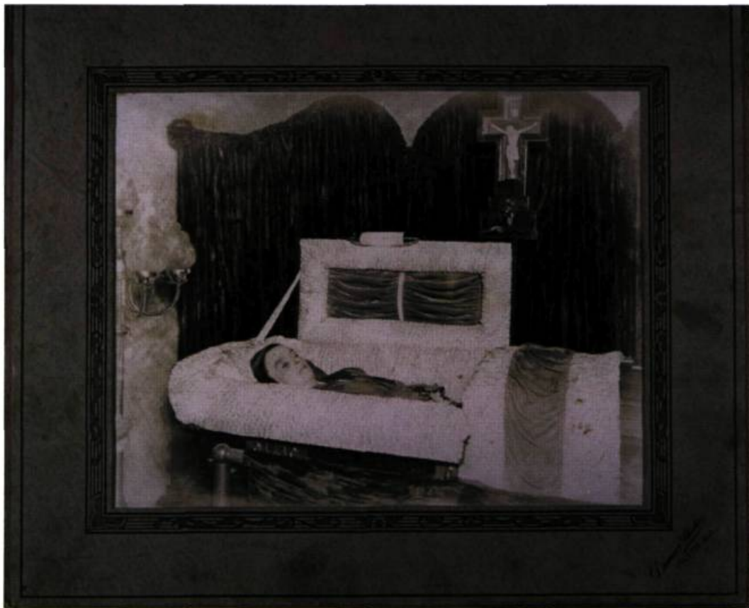
Photographie anonyme (Studio Demers, Joliette ?), non datée; 28, 5 x 33, 5 cm. N/b, non datée.

« Et pouvons-nous vraiment tout à fait négliger le facteur de l'incertitude intellectuelle après avoir admis son importance dans ce qu'il y a d'étrangement inquiétant avec la mort ? »