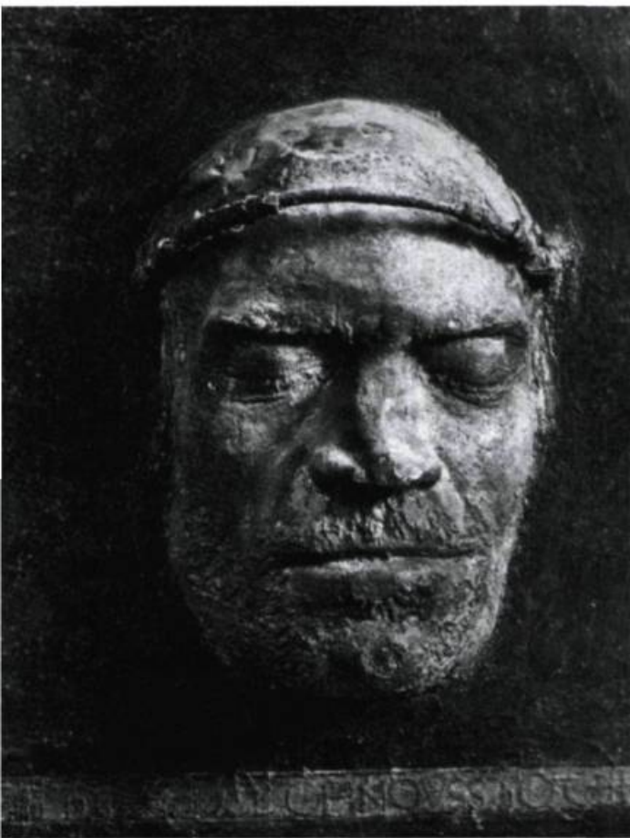
Masque funéraire de Laurent de Médicis, 1492, plâtre. Florence, Società Colombaria.