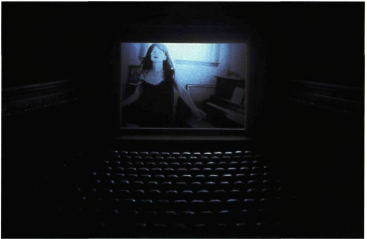
Janet Cardiff et George Bures Miller, The Muriel Lake Incident , 1999. Installation multimédia.

plus souvent des films noirs, tantôt une manière de rendre stationnaire le visiteur, pour mieux profiter de cette (fâcheuse) position. Reprenant à la perspective un dispositif ici lié à celui de la salle de cinéma, Cardiff, dans Playhouse (1997), ne permet qu'à un seul visiteur à la fois de goûter l'œuvre. Un à un, les spectateurs défilent. Après avoir écarté des rideaux de velours rouge, chacun entre dans la maquette de salle de théâtre dont la perspective, vertigineuse, laisse croire à un espace sensiblement plus vaste. Le visiteur devient alors le spectateur d'un opéra. Simple, l'œuvre exploite le principe qui sera repris plus tard dans les Walks . À une trame narrative principale se superposent des strates fictives différentes, qui parasitent les premières et ouvrent des intrigues au dénouement incertain.