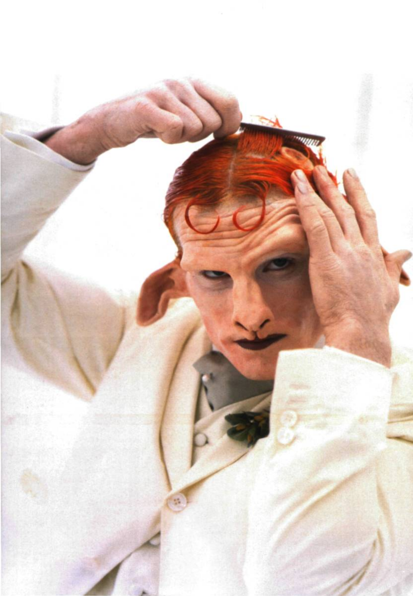
Matthew Barney, Photographie de plateau, 1994.