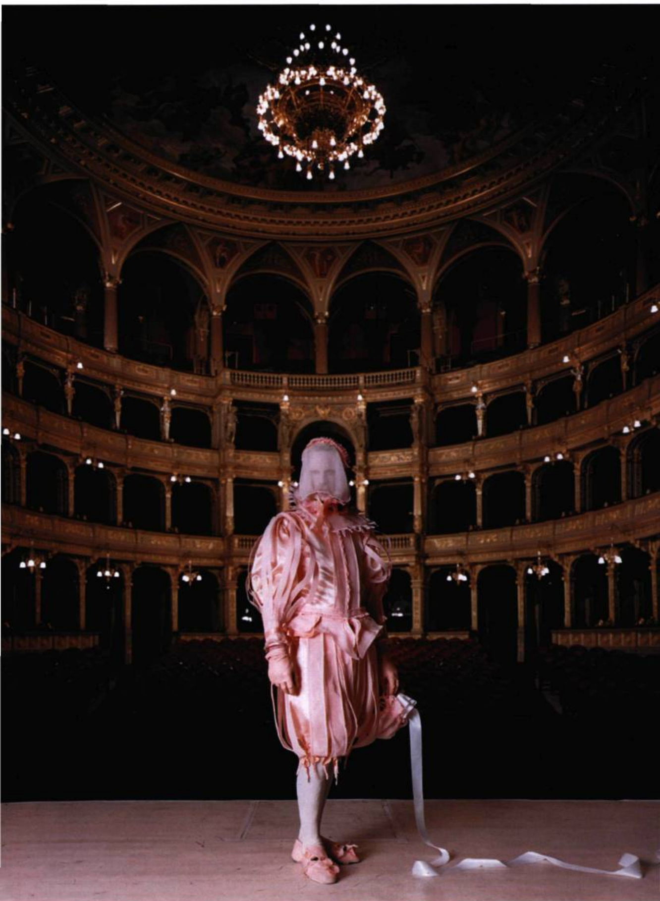
Matthew Barney, Photographie de plateau, 1997.