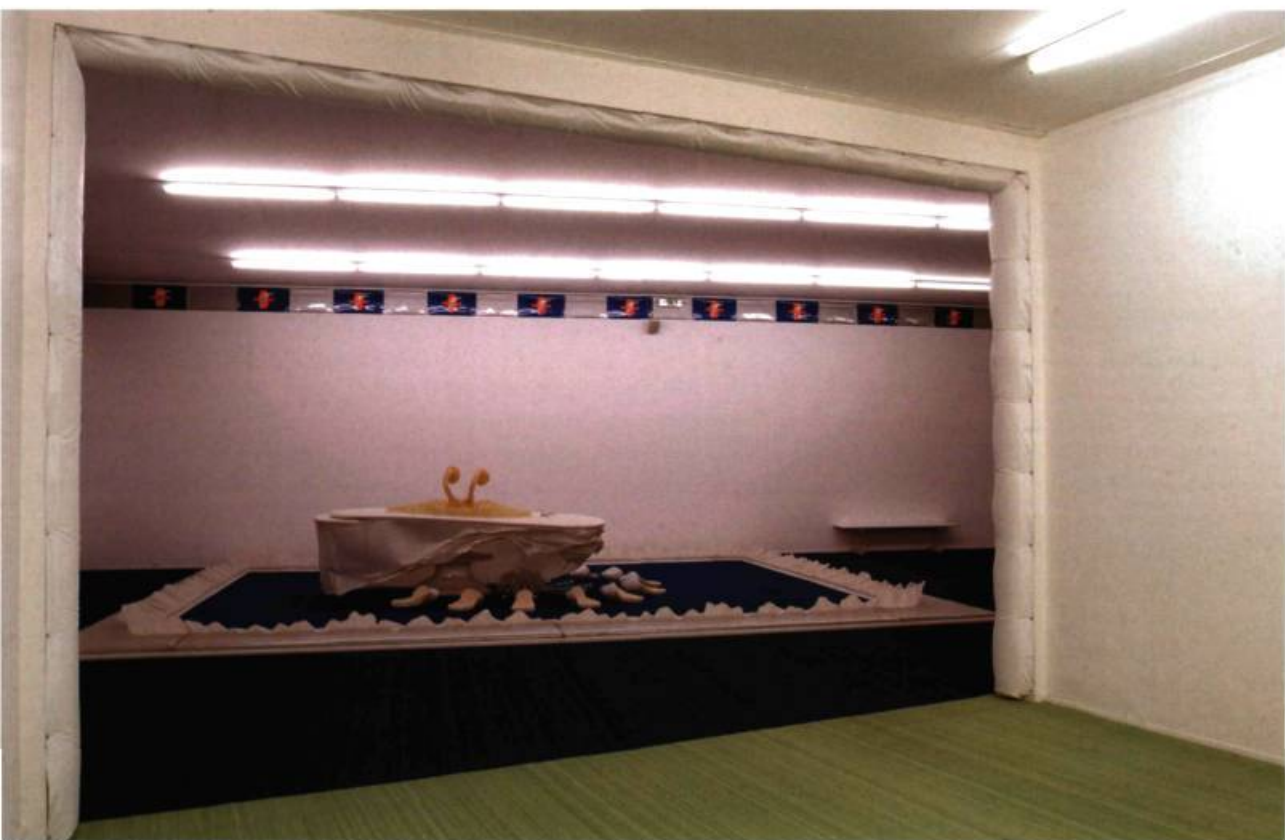
Matthew Barney, Photographie de plateau, 1995.