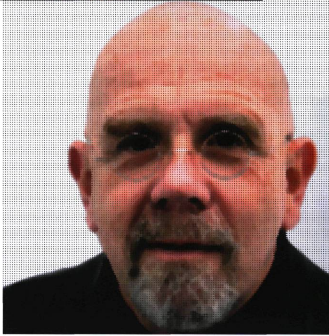
Jean-Pierre Seguin : C. C., 2003. Encre archive sur toile ; 112 x 112 cm.