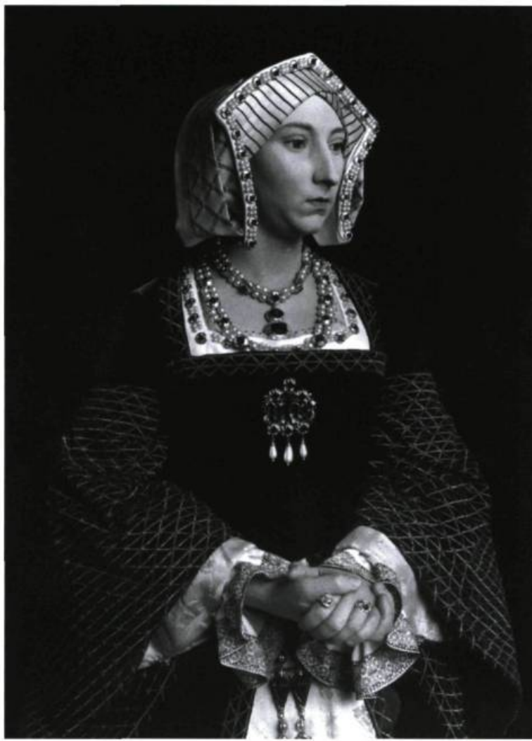
Hiroshi Sugimoto, Jane Seymour , 1999. Épreuves à la gélatine argentique, 149, 2 x 119, 4 cm. Extrait du livre Sugimoto Portraits , Guggenheim Museum Publications, 2000, p. 119.

un refus du mimétisme ou de la tradition, car il permet toujours de penser des notions aussi fondamentales que celles du signe, de la trace, de l'image, de la ressemblance, de la généalogie ; il continue surtout d'interroger le corps, l'absence, la mort et le passage du temps. Cela nous conduit à repenser le visage et son rôle car, comme le souligne Didi-Huberman, « Les visages ne nous reviennent et ne nous hantent que parce qu'ils nous laissent suspendus entre leur ressemblance, c'est-à-dire leur vocation, leur puissance de dissembler dans le moment même où ils se présentent à nous. » 18