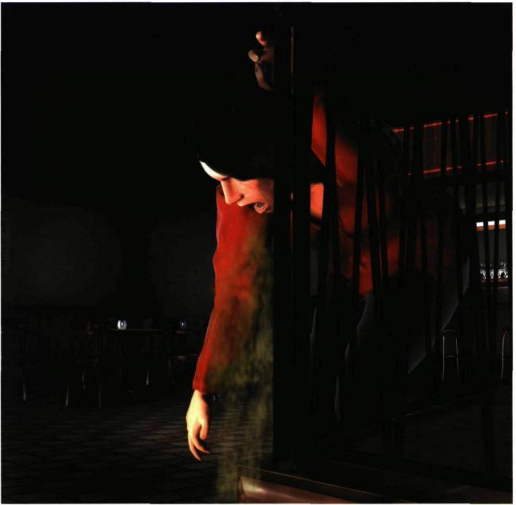
Emmanuelle Léonard (en collab. avec Alexandre Brunel), Kill the Drunk Woman , 2004. Photographie en couleur; 155 x 120 cm.

ultime de cette pulsion autodestructrice. Le pixel ici bien visible évoque l'intensité et la poussée criante de cette entreprise fatale. En trois instants, elle se penche et ce pistolet se rapproche de la tempe pour y coller fortement. Images volées d'un suicide qui, disposées ainsi à la verticale, alimentent cet effet de sens lié à la chute. S'agit-il ici de la mise à mort de l'Auteur ? La fiche descriptive accompagnant Fait divers atteste de l'anonymat du Je-photographe.