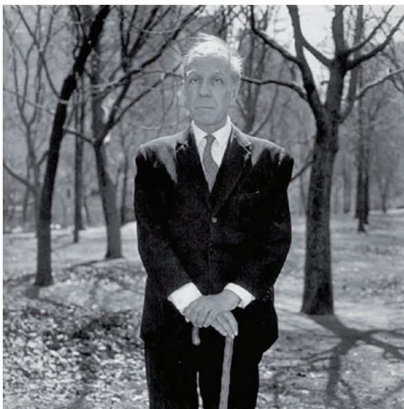
Jorge Luis Borges par Diane Arbus, 1968. Photographie.