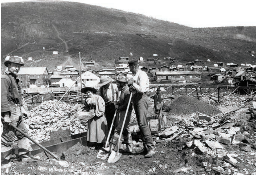
City of Gold / Capitale de l'or (1957)

le cow-boy et sa fière monture. Pour ajouter à la simplicité du propos, les images sont accompagnées d'un commentaire musical pour guitare solo écrit par Eldon Rathburn. Si un carton célébrant l'art et la difficulté du dressage ouvre le film, aucune mise en situation et nul commentaire n'accompagnent les images : au spectateur de « faire » son film. Corral est un poème lyrique dans lequel, avec une admirable simplicité, Low et Koenig affirment leur foi dans le cinéma.