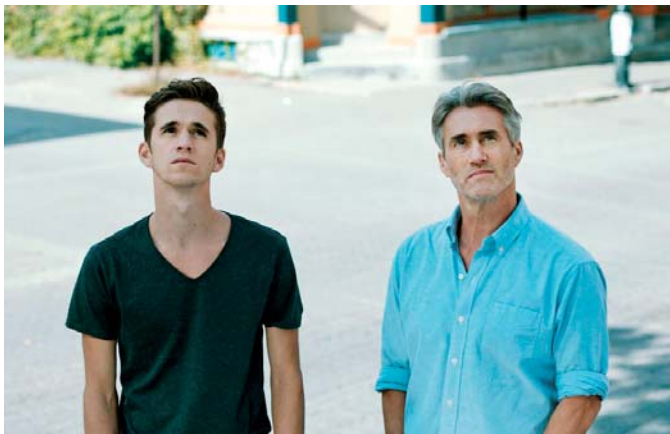
Là où Atila passe (2016)