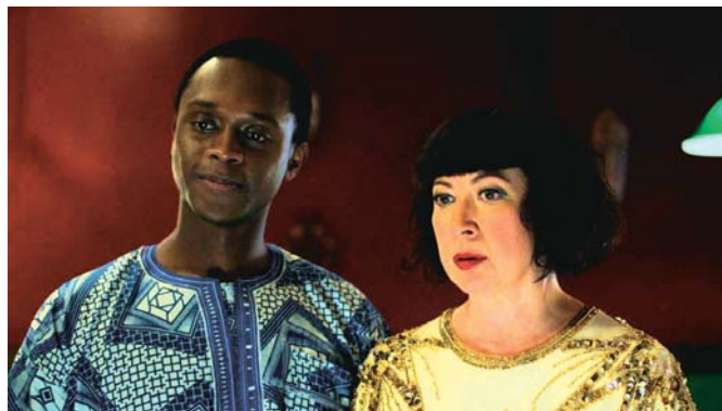
Le Cœur de Madame Sabali (2015)