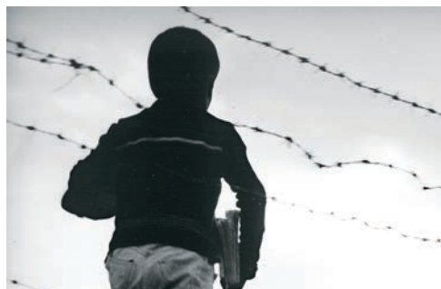
Kiarostami sur le tournage du Goût de la cerise (1997), Le pain et la rue (1970), Où est la maison de mon ami (1987) et Breaktime (1972)