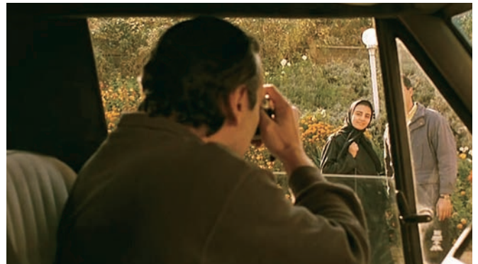
[1] Et la vie continue (1991), [2] Ten (2002) et [3 et 4] Le goût de la cerise (1997)

son voile à la fin). Le jeu du champ-contrechamp produit une grande tension des sentiments qui varient et se bousculent, disant l'incommunicabilité, la révolte, le sacrifice, et nous fait passer du mélodrame au drame romantique. Abbas Kiarostami nous donne une leçon de cinéma vertigineuse.