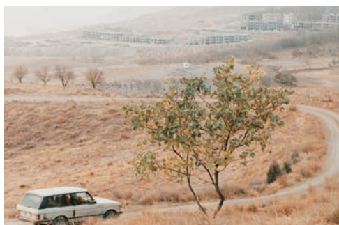
[1] Où est la maison de mon ami? (1987), [2] Le vent nous emportera (1999) et [3 et 4] Le goût de la cerise (1997)

nourrissent une attente sans dire laquelle, alimentent notre impatience de savoir, entretiennent subtilement un suspense. Quand l'homme se couche dans sa tombe, on comprend qu'il veut mourir, donc se suicider, mais le suicide reste un sujet tabou en Iran ; or, ruse et résistance de sa part, le cinéaste enchaîne par un fondu sur une équipe tournant un film, mise en abyme qui servira en même temps à éviter de souligner le fait du suicide. Le goût de la cerise est une œuvre troublante, angoissante, totalement noire philosophiquement parlant, dans laquelle le cinéaste est au sommet de son art, ce qui se confirmera tout de suite après avec Le vent nous emportera (1999), condensé de tous les éléments de mise en scène kiarostamiens : du village au Kurdistan iranien aux déplacements en voiture, en passant par un enfant servant de guide à un ingénieur venu de la capitale et des situations mystérieuses.