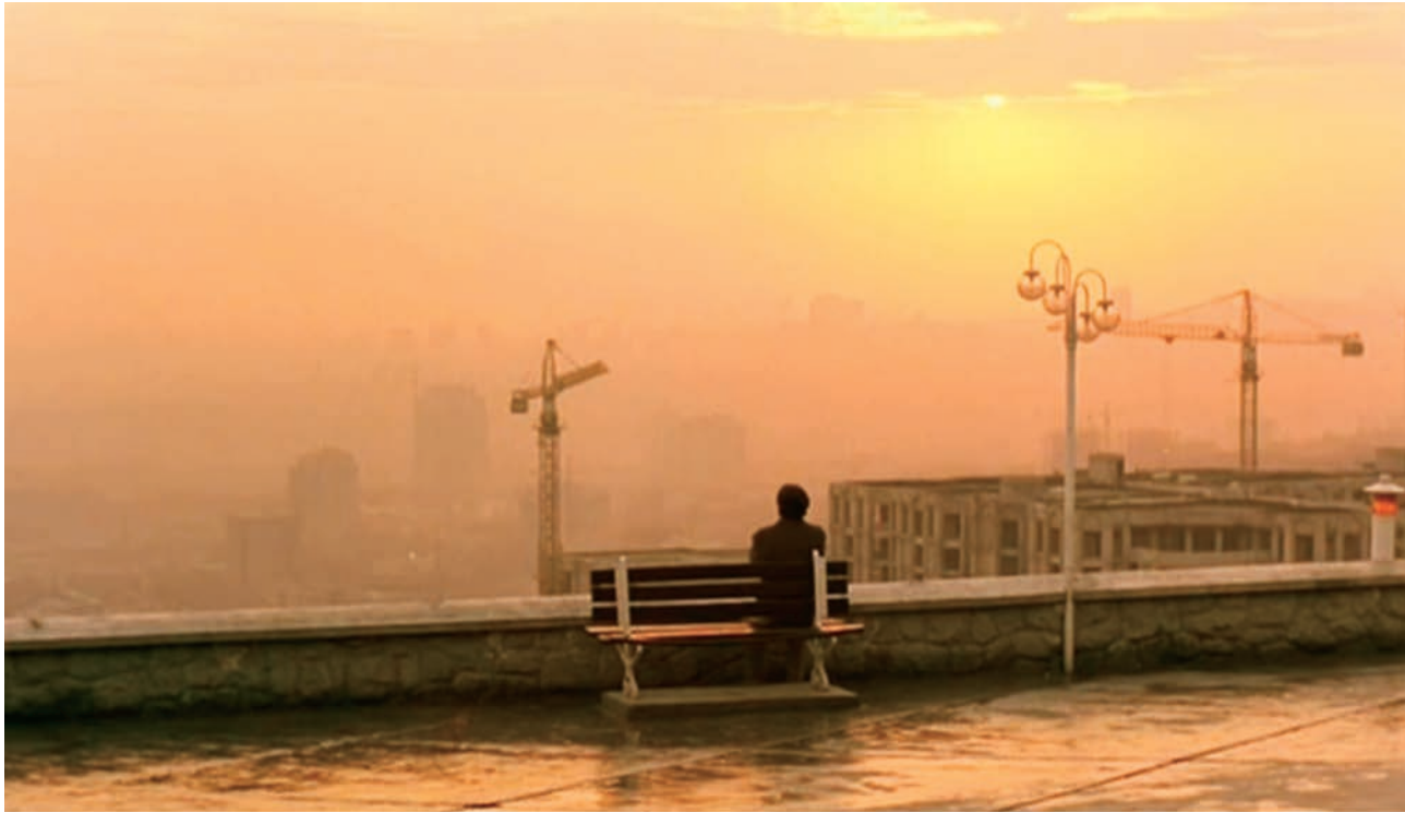
Le goût de la cerise (1997)