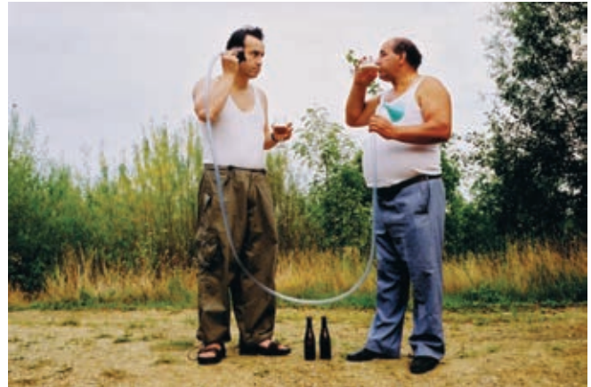
SCÈNES DE CHASSE AU SANGLIER et ESPRIT DE BIÈRE (2000)

de la maîtrise qu'on retrouve en général dans le cinéma et dont on semble partout jouir.