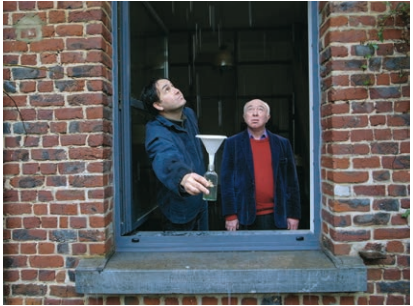
EXERCICES DE DISPARITION (2011)