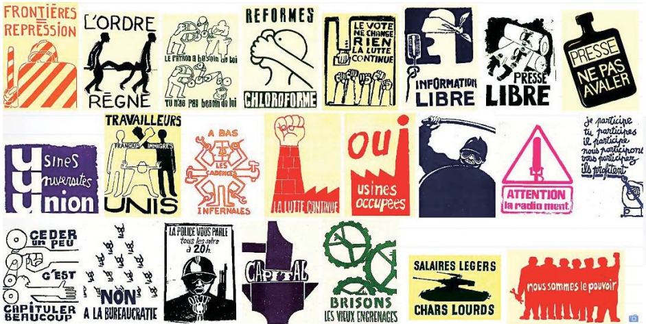
↑ Affiches de Mai 68 – Anti-K ↑ Affiche du film collectif Loin du Vietnam ↑ Couverture Le cinéma s'insurge n° 1 – États généraux du cinéma – Eric Losfeld éditeur – Le Terrain Vague 1968