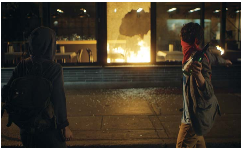
↑ Après Mai de Olivier Assayas (2012) → Ceux qui font les révolutions à moitié... de Mathieu Denis et Simon Lavoie (2016)