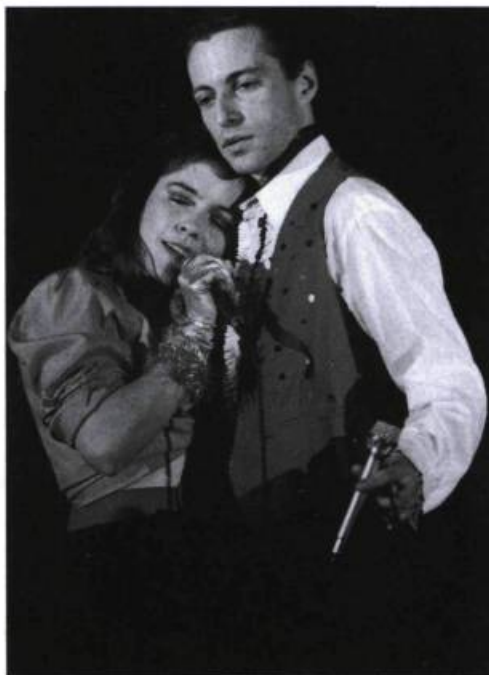
Après moi, le déluge , Productions Itinéraires (Montréal) ; texte : Daniel Beaudoin ; mise en scène : Sophie Côté, Kathleen Timmony et Éric Forget.