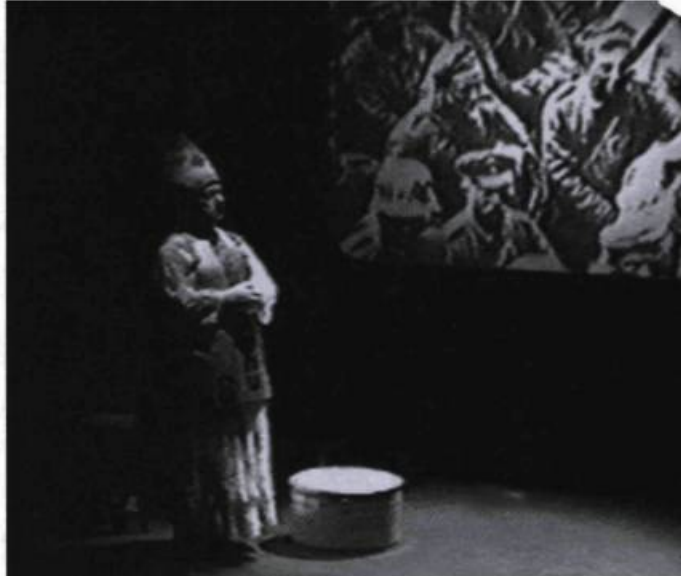
Roncalli (Alias Jean XXIII) , spectacle conçu, mis en scène et produit par Marcelle Hudon.

nous sommes conviés, où l' auto ne peut plus vraiment se penser en fonction de « l'identité » du sujet, ni le bio en terme d'opposition à la mort ; il en va de même pour l'élément graphique (graphique au sens d'une transcription, dans une « grammaire » gestuelle, de la sensibilité de l'acteur), qui va bien au-delà de la représentation ou de la mimesis , pour s'articuler autour d'une multitude de traces mémorielles sans liens apparents. Peter James se livre ainsi à un exercice qui explore les limites de l'individu dans sa relation au « moi » et à son autre (l'« indivi » étant toujours menacé de dissolution par sa « dualité », de là les références continuelles à la mort du sujet dans ce spectacle). En fait, Frédérique Lecomte et Peter James mettent en scène une série d'actes qui font écho à l'inconscient de l'acteur, et ce à partir d'un événement initial, soit, ici, le meurtre que l'acteur prétend avoir commis et qu'il décrit avec moult détails tout en le réactualisant sous nos yeux.