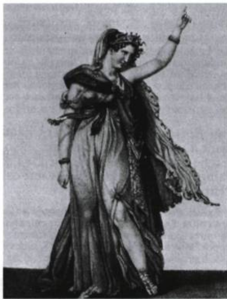
La Champmeslé (1642-1698) dans le rôle de Phèdre, qu'elle a créé. Œuvre de Prud'hon (fin XVIII e siècle).