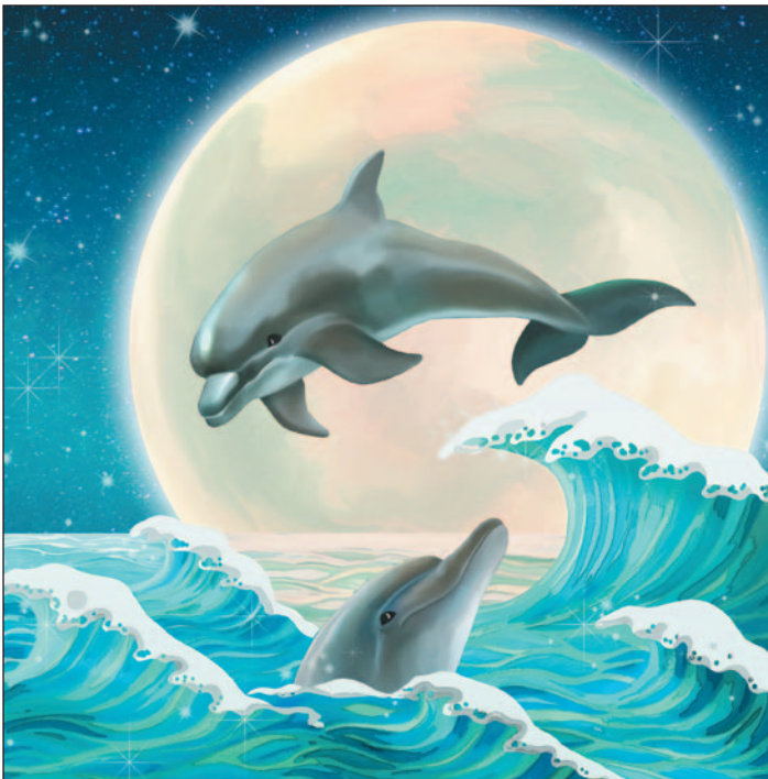
illustration : Laurine Spehner

Depuis ce jour, Pierrot et moi sommes inséparables. Sauf les jours où on nous sépare. Et ça arrive! Les jours de chimiothérapie. Ces journées-là sont longues, tristes, grises, mais on n'y peut rien. C'est pour notre bien qu'on nous a expliqué, une fois. Alors de ma chambre, je pense très fort à lui. Et de la sienne, il pense très fort à moi. Je le sais, je le sens.