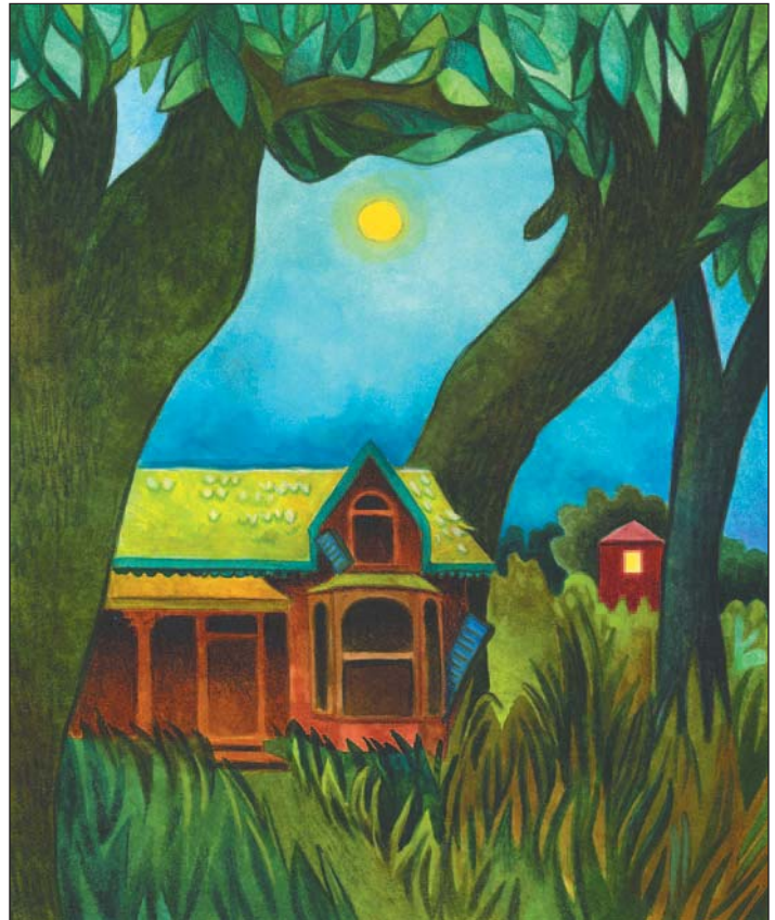
illustration : Caroline Merola

Depuis quelque temps, de nouveaux sons viennent régulièrement percer l'air des soirs d'été. Le bruit se rend parfois même jusqu'à ma chambre. C'est comme des hurlements à la lune, des geignements et des cliquetis. Cette maison semble réglée comme une horloge... Ça se passe toujours à la même heure. Terrifiée, je me recroqueville dans le fond de mon lit, sous les couvertures, en atten-