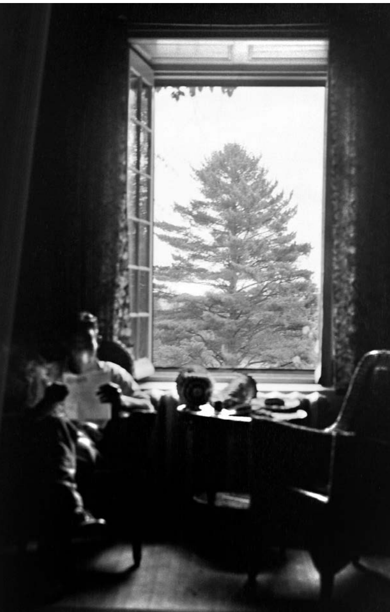
Saint-Denis Garneau dans son bureau de travail, vers 1935. © Jocelyn Paquet.