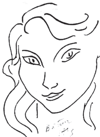
Henri Matisse, lithographie pour Les Fleurs du Mal , 1947.

Intervenant après une certaine fixation du sens du texte par le dessin qui lui répond, cette critique travaille au contraire à l'ouverture du sens de l'image pour lui permettre de correspondre à nouveau à la lecture plurielle que nous avons du texte baudelairien. En imposant une vision particulière, mais contre-intuitive des réceptions créatrices des poèmes, elle permet de justifier l'appariement texte-image choisi par les artistes et d'inviter tout spectateur à trouver lui-même une raison à cette association en laissant résonner conjointement en lui le dessin et la lettre. La définition aragonienne du beau