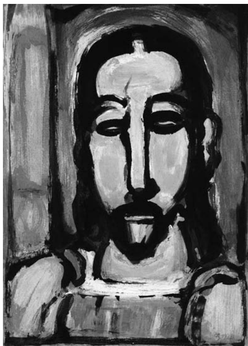
Georges Rouault, Visage du Christ , planche XX tirée de Les Fleurs du Mal , 1938.

disparu : « Matisse est demeuré, mais Baudelaire s'est évanoui : le portrait est bien celui du même homme, de la même femme, mais le drame n'y est plus. » Or, si Matisse va, comme l'affirme Aragon, « plus loin que les semblances fixées 9 » pour atteindre le drame humain, en quoi peut-on dire que ces dessins sont baudelairiens ? Le dessin, selon cette lecture du lien texte-image, se rapporte au poème par un détour qui préserve le mystère du texte. Dans ce détour se joue l'interprétation plastique du verbe : l'inadéquation apparente serait ainsi le signe de la lecture attentive qui refuse le commentaire. De ce détour par la face humaine résulte une incarnation désincarnée, qui n'est pas sans évoquer le lyrisme impersonnel de la poésie de Baudelaire.