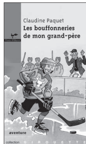
Illustration : Paul Roux

Voici un roman qui illustre une relation de complicité entre un grand-père assez original et son petit-fils, ayant comme toile de fond une saison de hockey. Pour les 9 à 12 ans.