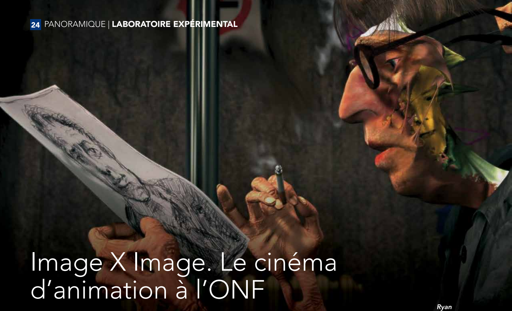
Image X Image. Le cinéma d'animation à l'ONF