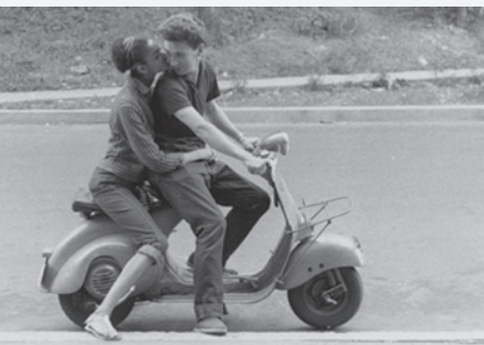
À tout prendre