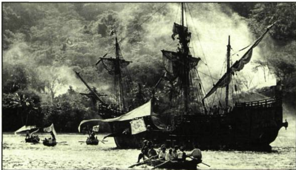
1492 de Ridley Scott

Mais la mer est aussi un lieu sur le globe. Les vaisseaux ont écrit l'histoire de l'humanité sans cesse en quête d'un ailleurs à la rencontre d'elle-même. Il y a ces navigateurs, réels tel Christophe Colomb, mythiques tel Sindbad, légendaires tel Sadko ou comiques tels Buster, Charlot, Laurel et Hardy, se laissant distraire le temps d'une escale par des amours fugaces et des rencontres de