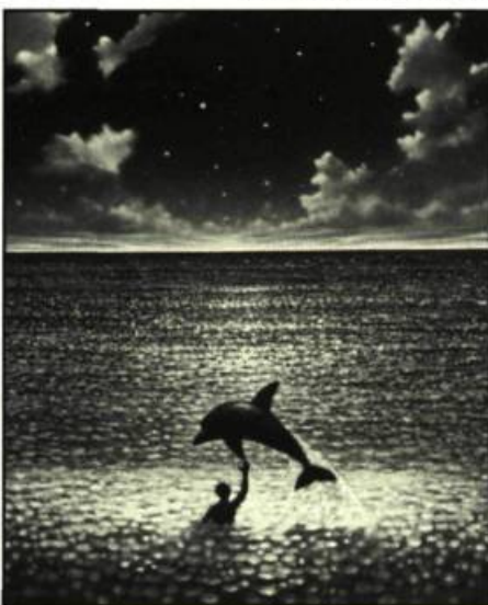
Le Grand Bleu de Luc Besson

cinéma contribuant toujours plus largement à la création d'une symbolique maritime.