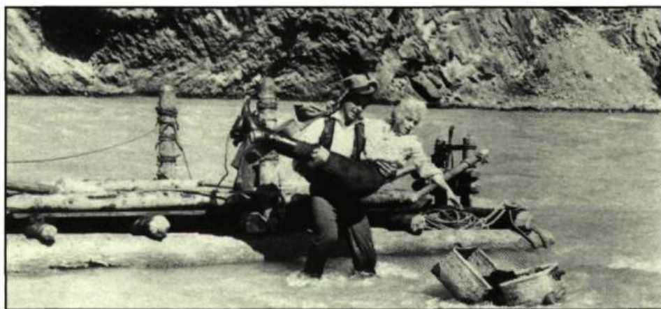
River of no Return de Otto Preminger