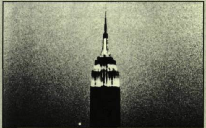
Empire d'Andy Warhol

Quelques nuits plus tard. Toujours au coin de Guilbault, cette fois-ci le Festival nous convie à la Première mondiale de Strange World , le film concert qu'a réalisé François Girard, en Italie, lors de la tournée de Peter Gabriel. Ce soir, la nature se met de la partie pour transformer une réalisation un peu banale en show inoubliable. Je dis banale parce que Girard n'a pas pu ou n'a pas su créer une véritable mise en scène cinématographique. À une exception près, ses caméras se contentent de filmer l'action de l'espace hors scène. Pratiquement aucune interaction, donc, entre la lentille et Gabriel; aucune