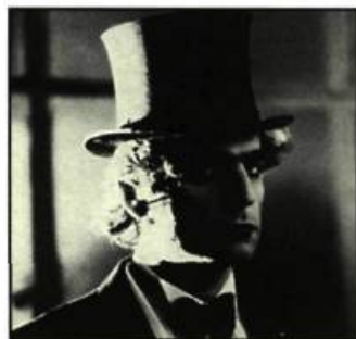
Lettre pour L... de Romain Goupil

«Qu'est-ce qu'un film bien aujourd'hui?». Cette question est celle que le cinéaste se pose tout le long de ce récit à résonance autobiographique. Lettre pour L... permet à Romain Goupil de