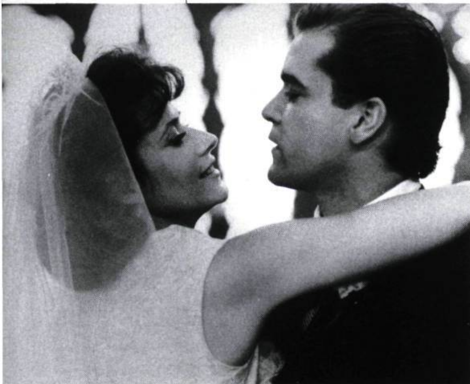
Lorraine Bracco et Ray Liotta dans Good Fellas