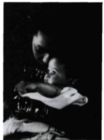
L'Arbre qui dort rêve à ses racines de Michka Saäl