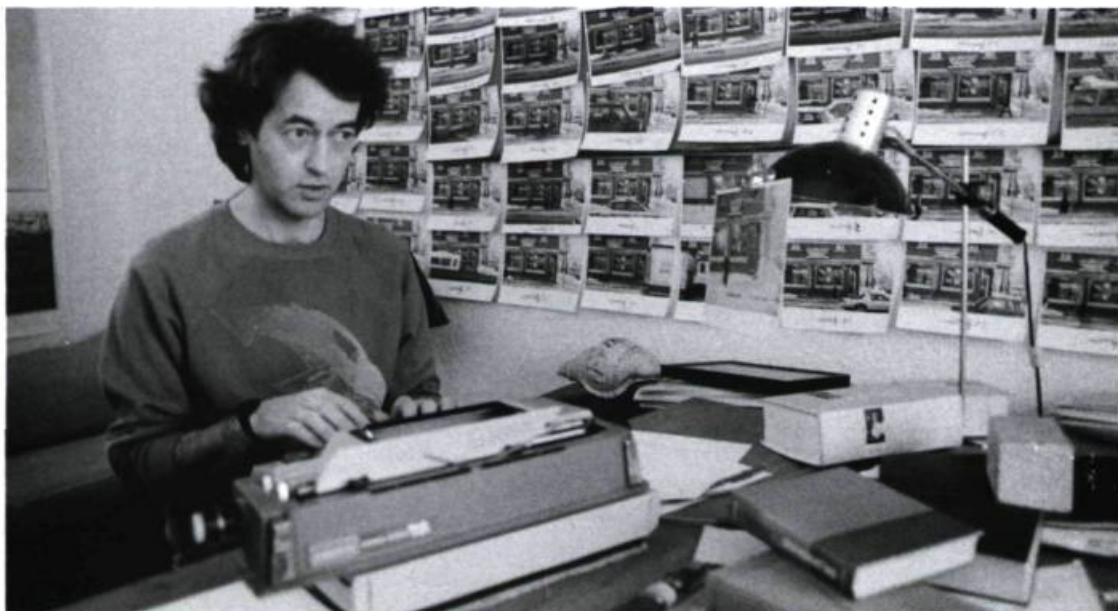
Les Matins infidèles de Jean Beaudry et François Bouvier (1989) (Photo: Luc Sauv )

Ciné-Bulles: Vous avez fait beaucoup d'auditions pour trouver l'interprète de Nathaël, Félix-Antoine Leroux?