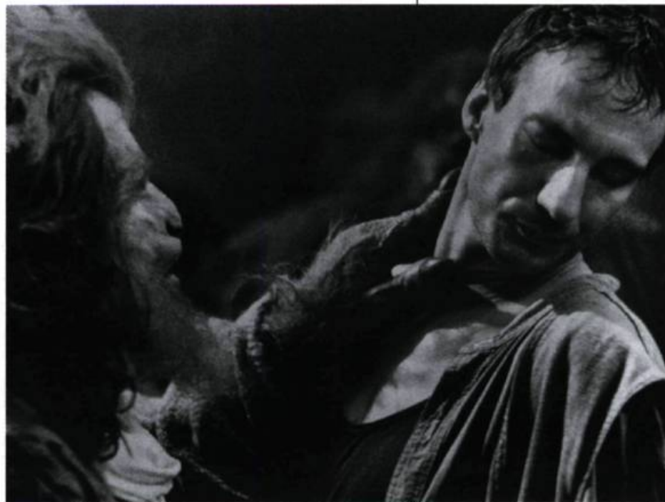
The Island of Dr. Moreau de John Frankenheimer