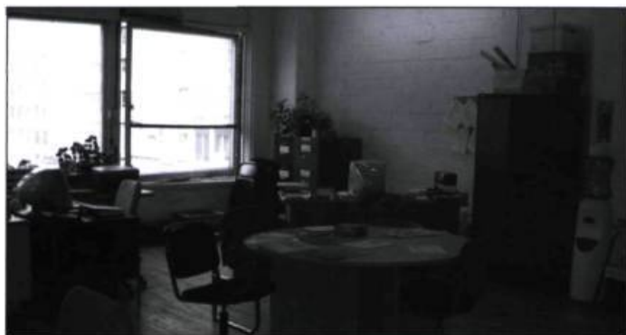
Les bureaux des Films de l'Autre

Lorsque son projet est accepté, le nouveau membre se retrouve dans une communauté de cinéastes qui ont tous le même but : faire du cinéma le plus librement possible. Hugo Brochu précise : « Nous avons un rôle de cadre, de soutien. On fournit aux producteurs-réalisateurs des outils pour qu'ils puissent mener à bien leurs projets : comment faire un contrat type, des devis de budgets, etc. Sur le plan administratif, le cinéma est une machine de plus en plus complexe. Notre rôle est aussi d'alléger ces contraintes administratives pour un réalisateur-producteur. » La