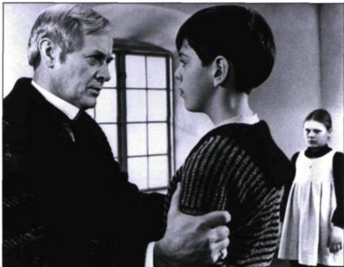
Fanny et Alexandre

personnages de Dostoïevski (tel le motif du « fils humilié » dans Sarabande , dans le rapport haineux qui oppose Erland Josephson à Jørgе Ahlstedt), tandis que les « réminiscences agréables » et les courts moments de grâce sur lesquels débouche l'optimisme in extremis de certains de ses films ont peut-être quelque dette envers les états de grâce exprimés par Proust dans Le Temps retrouvé . De fait, toute la tension d'un film de Bergman consisterait à passer de ce premier état au second, sans savoir si, justement, la difficulté des situations ne nous abandonnera pas quelque part sur le chemin tortueux qui mène, sporadiquement, à leur résolution... ou encore, inversement, à une aggravation irrémédiable (tel l'enfermement psychiatrique de Peter, devenu assassin, dans l'un de ses plus sombres films, De la vie des marionnettes ).