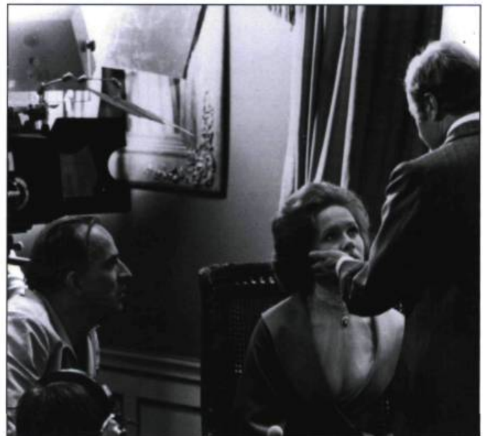
Ingmar Bergman sur le plateau de Cris et chuchotements

Laissons la question en suspens. Et en attendant, il y a Sarabande . Un prétendu dernier film, et pourtant moins une œuvre de clôture ou d'adieu qu'une œuvre ouverte et vivante, d'autant plus importante qu'elle relève d'un genre de cinéma comme il devrait s'en faire davantage et, pourtant, comme on n'en fait plus. Décidément, quand Bergman aura rendu son dernier souffle, le monde entier, privé des rayons de sa lanterne magique, risque de devenir un lieu beaucoup plus sombre. ■