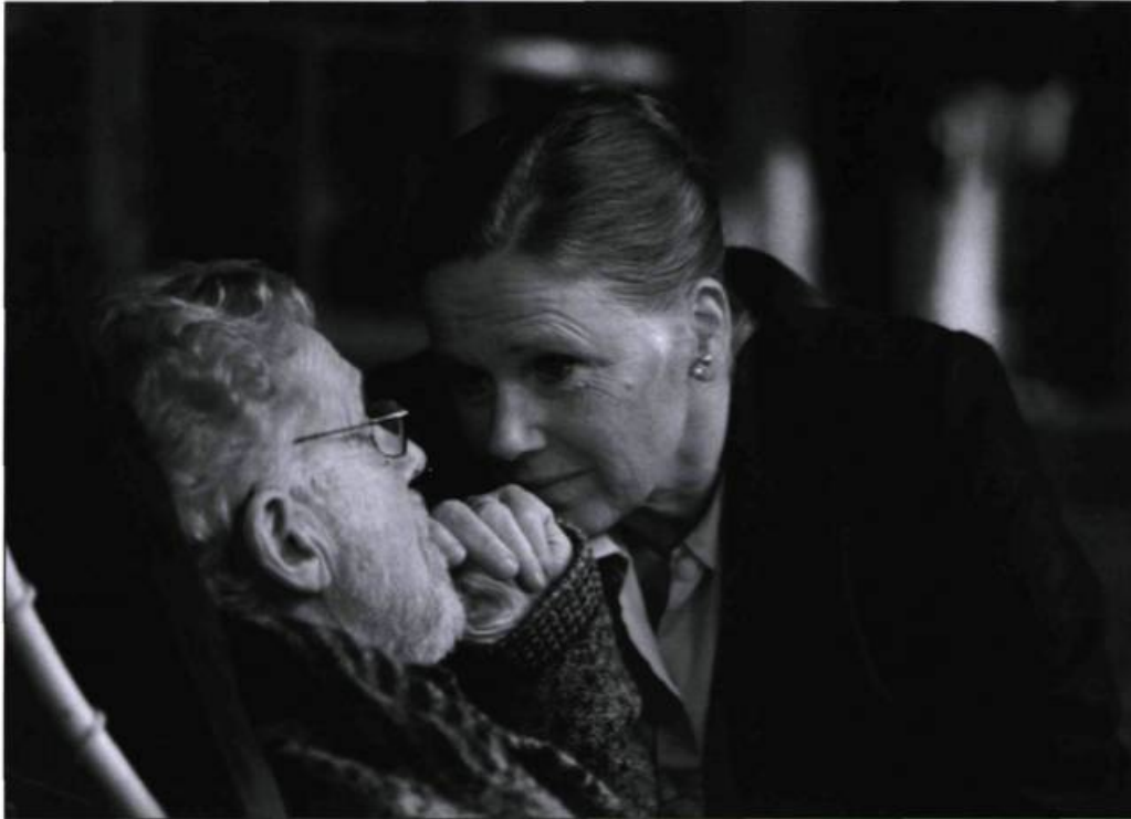
... et 30 ans plus tard dans Sarabande – PHOTO : BENGT WANSELIUS

Sarabande comme oppressant arrière-fond à une violente scène de dispute entre J. Dufvenius et B. Ahlstedt. De fait, bien que discrets, les décors font écho à la tension intérieure des personnages : silencieux, ou habités du tic-tac des horloges, ils expriment l'indifférence du monde; enveloppés d'ombre ou traversés de sublimes rayons lumineux (tel celui qui pénètre dans la chapelle où Liv Ullmann, après une discussion difficile avec Börje Ahlstedt, reste seule avec elle-même), ils portent aussi un certain espoir, une qualité rassérénante.