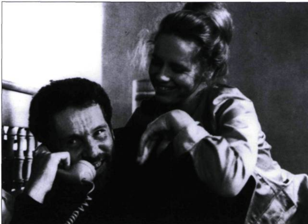
Erland Josephson et Liv Ullmann dans Scènes de la vie conjugale ...