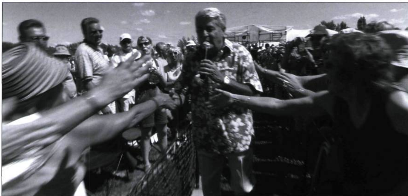
La scène d'ouverture du film Les Dames en bleu