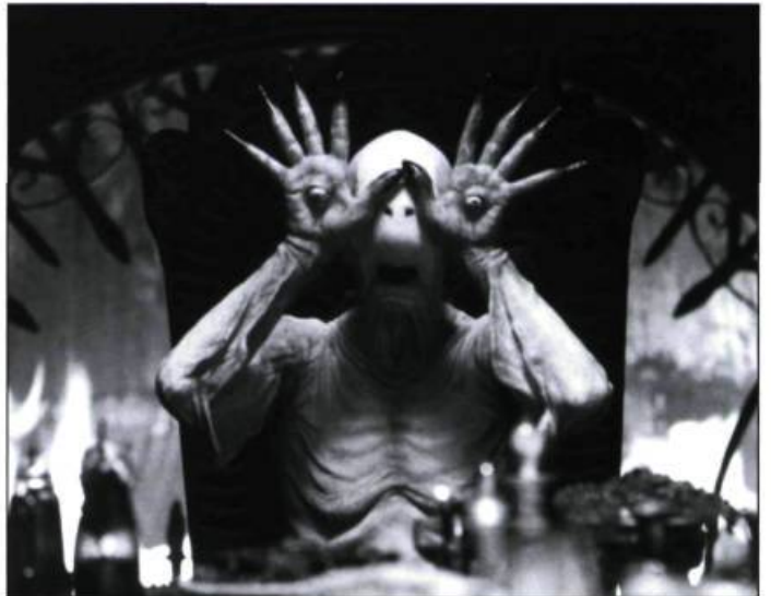
Le Labyrinthe de Pan