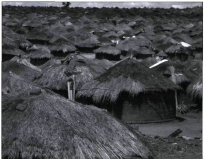
De l'autre côté du pays