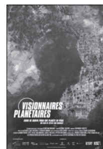
Québec / 2009 / 82 min