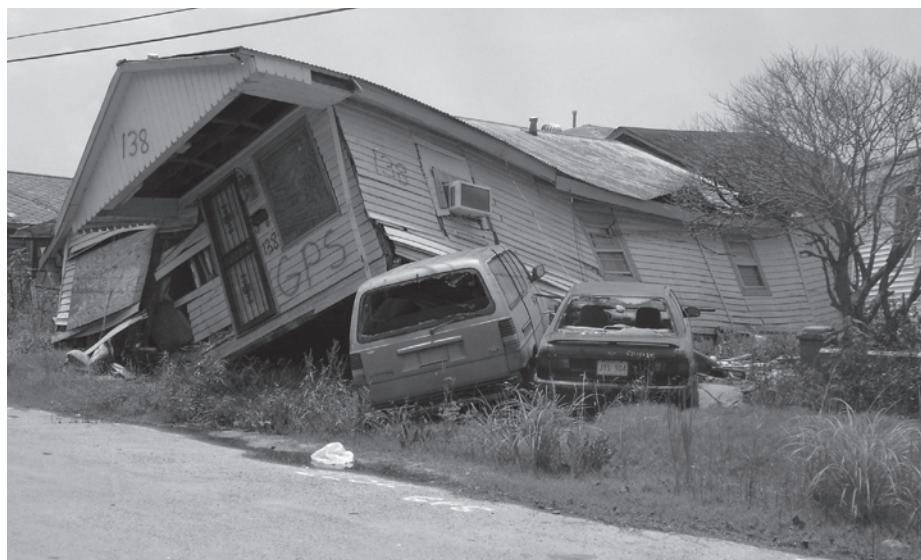
The Age of Stupid

Un peu par acquis de bonne conscience, The Age of Stupid tire dans toutes les directions, de sorte qu'il s'inscrit comme un film d'introduction et d'éducation à la cause environnementale. Tandis que Visionnaires planétaires , avec ses figures résolument dans l'action, serait davantage un film de maturité, porteur d'une réflexion plus engagée, voire plus engageante. D'une manière ou d'une autre, nous nous plaisons à rêver d'une diffusion élargie pour de tels outils, quitte à répéter s'il le faut le même refrain. Et à donner raison à De Laet: « On se doit d'être des catastrophistes éclairés. » ▀