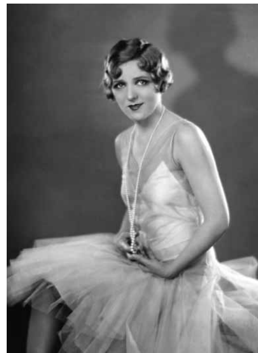
Mary Pickford dans Coquette (1929)