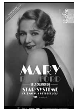
Mary Pickford et la création du star-système

Art démocratique par excellence, le cinéma, qu'il soit muet ou de science-fiction, conserve cette aura magique capable de drainer des néophytes au Musée McCord ou au Centre des sciences. En cela, le septième art y méritera toujours sa place. Les étoiles passent, la fascination demeure. ▀