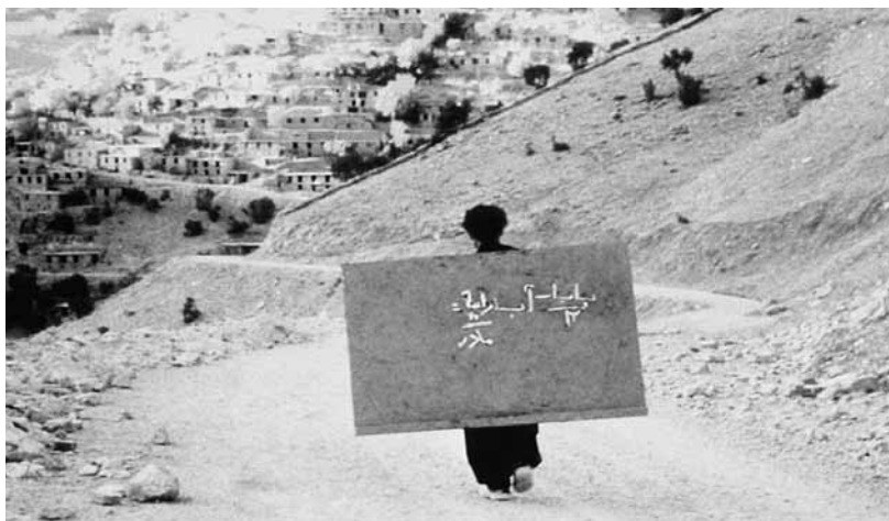
Le Tableau noir

Autre œuvre majeure du nouveau cinéma iranien, celle de Jafar Panahi rassemble un certain nombre de thématiques essentielles à sa compréhension. Les figures de la femme et de l'enfant, qu'on évoquait à propos d' Une séparation , trouvent chez Panahi leur expression la plus aboutie. Ses deux premiers films, Le Ballon blanc (1995) et Le Miroir (1997), relatent des parcours d'enfance traversés par la capitale (Téhéran) qui en définit l'itinéraire. La délicatesse de Panahi à leur égard est manifeste; en même temps, il ne leur épargne pas les difficultés de l'existence, et parfois même l'hostilité du monde adulte, devant lequel l'enfant est profondément seul. C'est ainsi qu'on