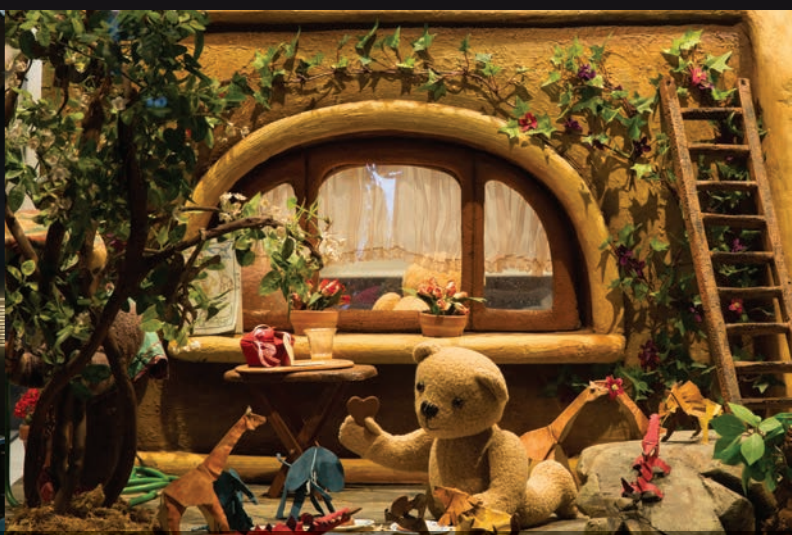
De haut en bas et de gauche à droite: Vue d’ensemble de la salle d’exposition / Maquette du film Dehors novembre (2005) de Patrick Bouchard / Studio où les cinéastes en résidence travailleront en direct sous les yeux des visiteurs / Un exemplaire des chaises d’ Il était une chaise (1957) de Norman McLaren et la monteuse son et image utilisée par le cinéaste vers 1955 / Décor du film Ludovic – Un croco dans mon jardin (2000) de Co Hoedeman — Photos: Jessy Bernier / Perspective