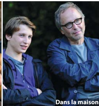
Dans la maison