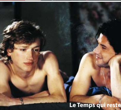
Le Temps qui reste