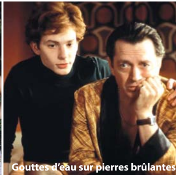
Gouttes d'eau sur pierres brûlantes