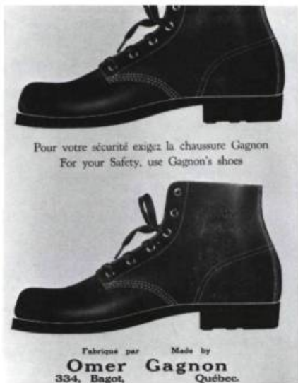
Une publicité d'Omer Gagnon.