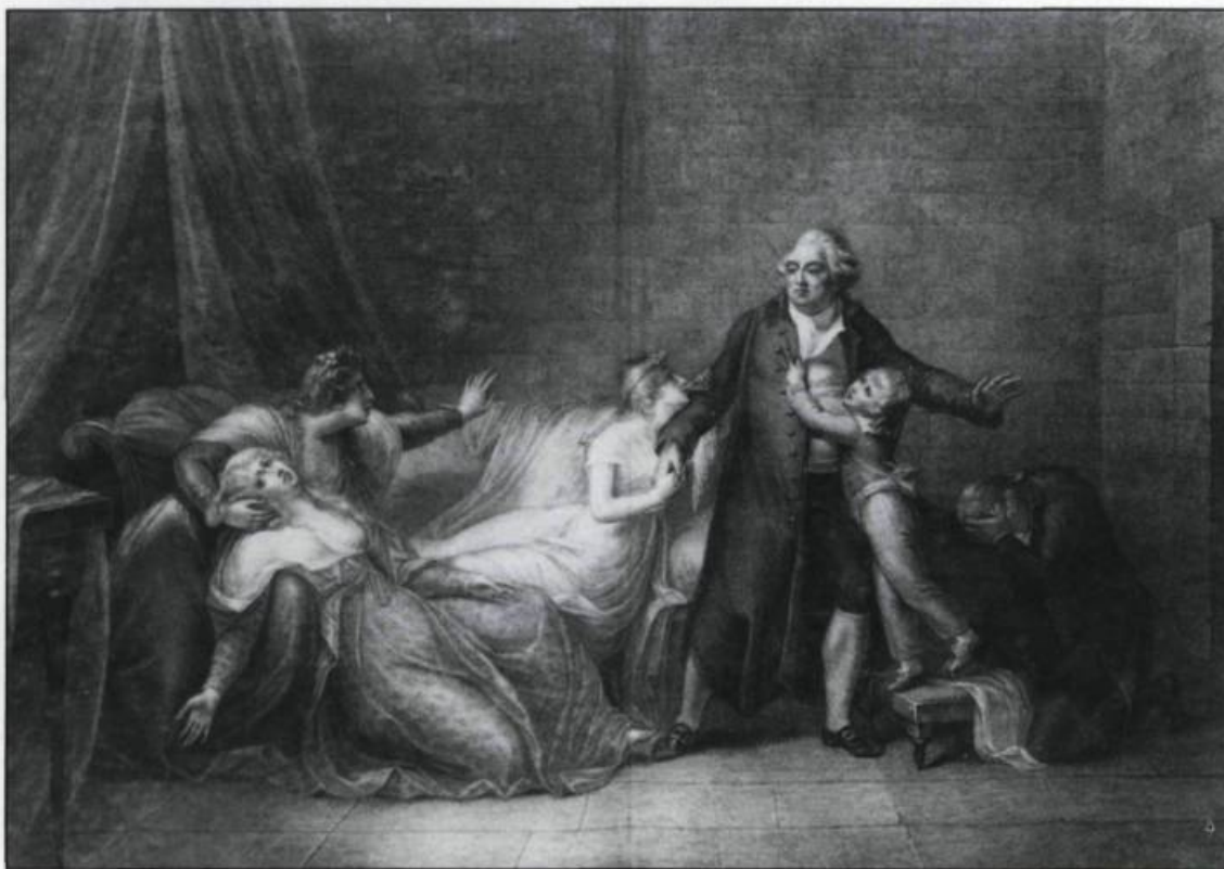
«Massacre of the French King!» Placard typographique comportant une gravure à l'eau-forte publiée à Londres pour William Lane «at Minerva Press», 1793. (Bibliothèque nationale, Paris).