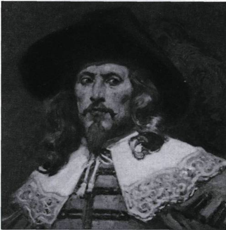
Paul de Chomedey, sieur de Maisonneuve (Nouvelle-sur-Vanne en Champagne, 1612-Paris 1676). Illustration de Marc-Aurèle De Foy Suzor-Côté. (Héroïsmes d'antan-Victoires d'aujourd'hui, 1923).

À cause de l'arrivée tardive d'un des trois navires qui amènent au Canada la recrue, l'entreprise choisit d'hiverner à Sillery dans des maisons