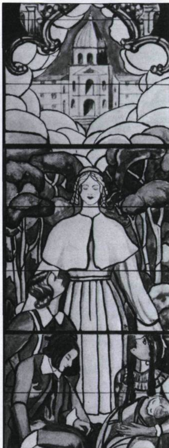
Ce vitrail de la basilique Notre-Dame de Montréal rend hommage à Jeanne Mance (1606-1673), fondatrice de l'Hôtel-Dieu de Montréal et collaboratrice importante de Maisonneuve. (Nos Racines, p. 328).

L'aide de Jeanne Mance rend possible le recrutement d'une centaine de nouveaux colons en 1653, permettant ainsi à la petite colonie de l'île de Montréal de recevoir l'appui nécessaire pour résister aux attaques ennemies.