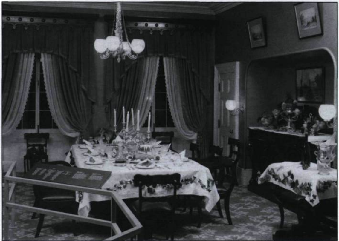
Reconstitution d'une salle à manger du milieu du XIX e siècle. (Photographie. Service canadien des parcs).