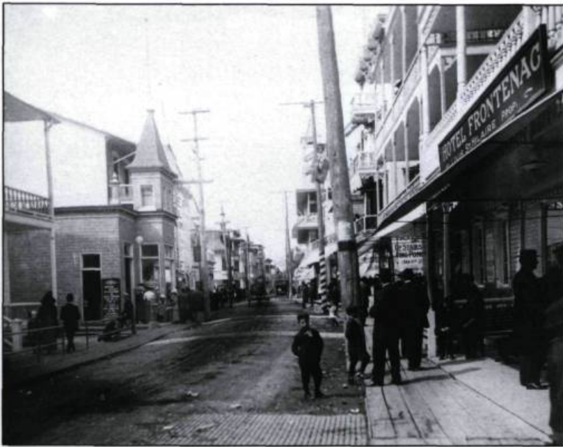
«L'avenue royale à Sainte-Anne-de-Beaupré vers 1910». Parmi les formes anciennes de villégiature, celles suscitées par les lieux de culte et les terres de miracles s'ajoutent aux paradis de chasse et de pêche et aux sites panoramiques. (Archives du Monastère des rédemptoristes de Sainte-Anne-de-Beaupré).

profiter de l'été. Le phénomène prend corps dans l'entre-deux-guerres. Au Québec, comme le signale Roger Brière, l'auteur d'une thèse remarquable sur la géographie du tourisme au Québec, «[...] 5 452 véhicules de promenade étaient enregistrés en 1913. Sept ans plus tard, en 1920, on en comptait 35 965 et en 1930, 140 802, soit vingt fois plus». À la villa bourgeoise des grandes stations estivales et des banlieues rurales cossues de Québec et de Montréal, succède le chalet d'été au bord du lac, de la rivière, du fleuve. Les entassements de ces maisonnettes d'été donnent lieu à une vie sociale bien particulière, célébrée par l'auteur Claude Jasmin, dans le cas de Pointe-Calumet. En parallèle, un tourisme nomade ou tourisme itinérant s'ajoute aux autres formes de villégiature. L'automobiliste peut loger un ou plusieurs soirs dans une cabine, un mode de loge-