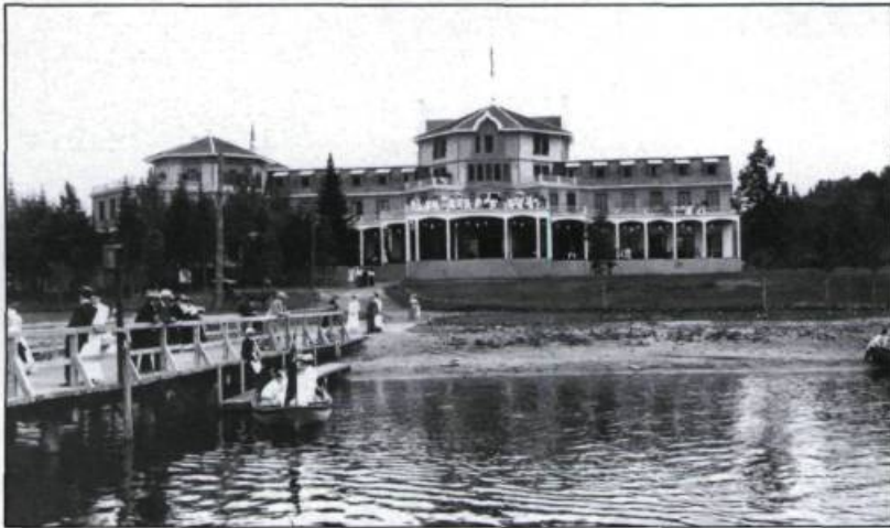
« L'Hôtel du Lac Saint-Joseph en 1905 ». La villégiature s'organise dans le voisinage des grandes villes, comme ici à l'arrière de Québec. Pendant les fins de semaine les stations connaissent un maximum d'activité. L'Hôtel du Lac Saint-Joseph (90 chambres) ouvre ses portes en 1905. La salle à manger peut accueillir 300 convives.

Les premières traces d'une villégiature bourgeoise un peu organisée dans la vallée du Saint-Laurent remontent au début du XIX e siècle. L'arpenteur Joseph Bouchette note en 1815 que le village de Kamouraska «[...]possède une ou deux auberges où les voyageurs peuvent être logés commodément et bien nourris. Durant l'été, ce village devient vivant par le grand nombre de personnes qui s'y rendent pour rétablir leur santé, ayant la réputation d'être un des endroits les plus sains de toute la basse province; on y prend aussi les eaux, et il s'y rend beaucoup de personnes pour l'avantage des bains de mer». Un peu plus tard, réflexe colonial oblige, James Macpherson LeMoine parle du lieu comme le «Brighton du Bas-Canada».