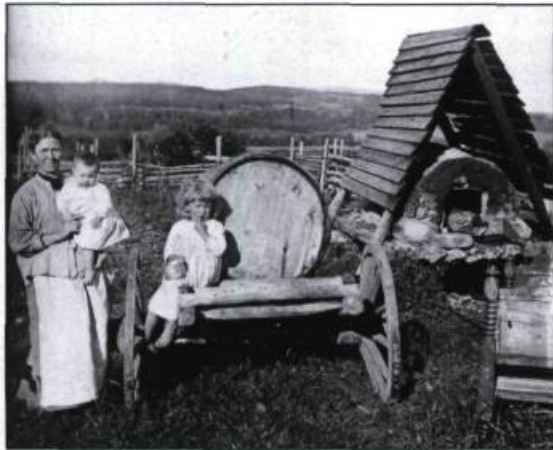
« Famille au four à pain dans Charlevoix vers 1890 ». Parmi les découvertes des vacanciers en pays pittoresque, on note l'exotisme du terroir.

exceptionnels, capables de provoquer l'extase chez ceux et celles qui sont accablés par le machinisme. Dans cet élan, les plans d'eau libérateurs, les chutes et les torrents, la mer, les montagnes et les gouffres à couper le souffle, les panoramas divins sont privilégiés.