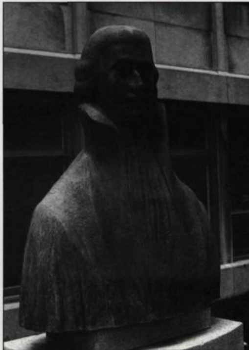
Sculpture de Raoul Hunter, ce monument de Joseph-François Perrault se trouve devant l'école du même nom, chemin Sainte-Foy à Québec.

de l'état civil à Québec. L'année suivante, il est élu député. Au fil des ans, il s'intéresse à l'éducation et met sur pied différentes ins-